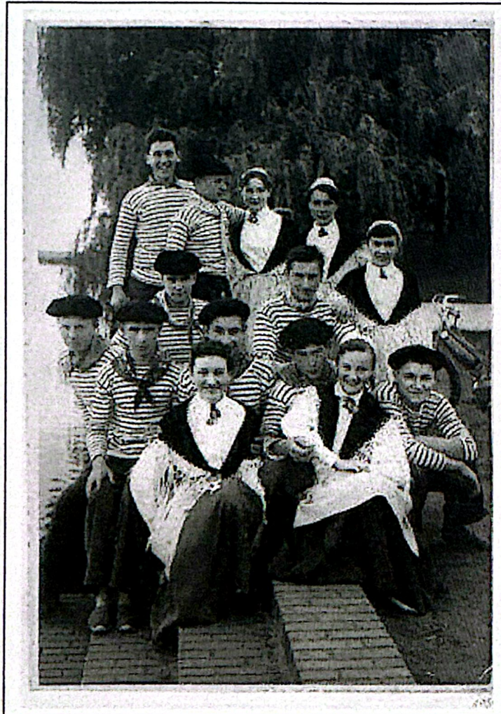
1955 – Au bord du lac