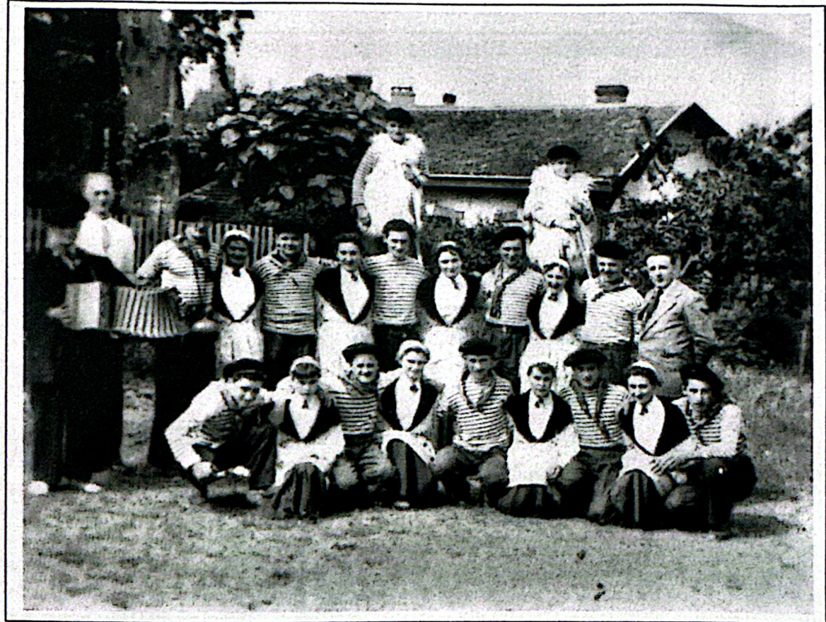
1956 - La 1 ère troupe complète des Cadetouns