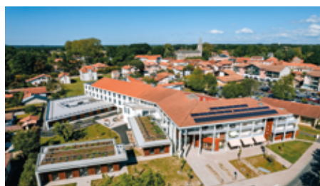
Les travaux de rénovation totale de l'EHPAD des Cinq étangs inaugurés au printemps 2023