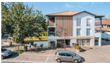
La création de nouveaux commerces en rez de chaussée de la résidence « Les Ombrages ».