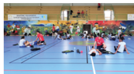
Le nouveau revêtement de sol de haut niveau du Hall des Sports du lac.