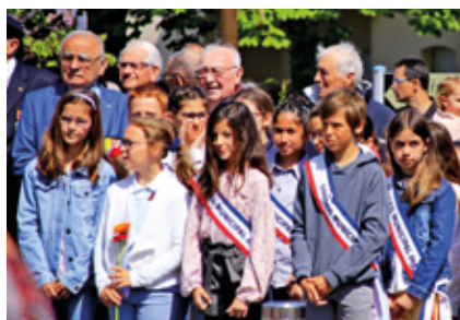
Les élus des CMJ participent à la commémoration du 8 mai 1945.