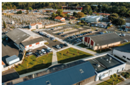
Le parking de la salle « A Noste » livré en janvier 2022.