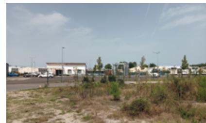
La zone d'activités commerciales et industrielles de Cramat s'est agrandie sur 3 hectares