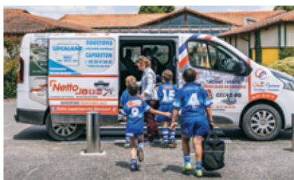
L'accompagnement gratuit des enfants aux activités associatives