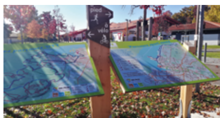
La plaine de l'Isle Verte, point de départ des parcours sportifs balisés de la commune