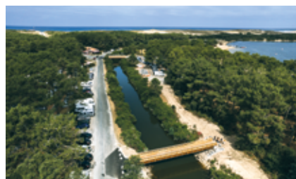
La passerelle qui assure la connexion directe entre le parking de la plage et la place des commerces du lac marin.