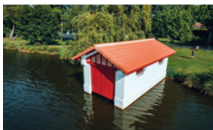
La réhabilitation de la « Maison » de la Faucardeuse par les services municipaux.