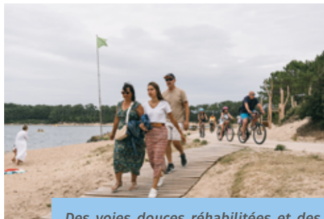
Des voies douces réhabilitées et des aménagements piétonniers créés pour partager l'espace en toute sécurité.