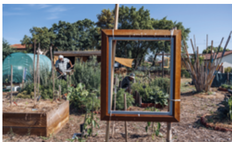
Le jardin partagé de Soustons créé à l'automne 2021.