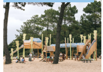
Une aire de jeux pour enfants au bord du lac marin.