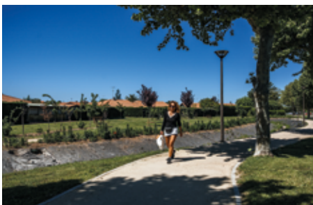
la balade des senteurs assure une continuité douce et nature entre lac et centre ville