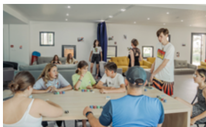
Un nouvel espace jeunes inauguré en septembre 2022