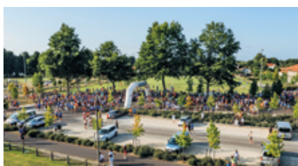
Plus de 2200 coureurs au départ du 10km de Soustons, devenu l'un des événements running les plus populaires des Landes