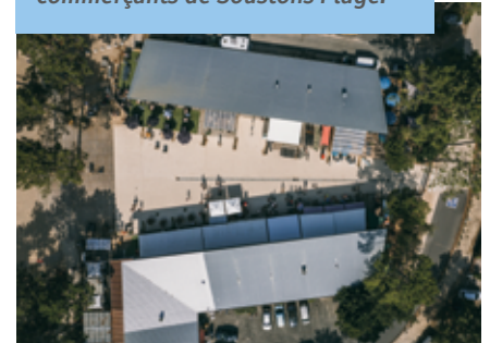
Une place des commerces rénovée pour conforter l'offre des commerçants de Soustons Plage.