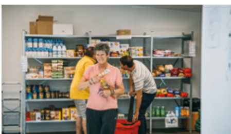
L'épicerie solidaire, inaugurée en 2019, accompagne près de 30 familles.

Cette structure a la capacité de réunir au total 18 praticiens (8 généralistes - 10 spécialistes). Elle est destinée à apporter une unité de projet médical, des protocoles communs, des réponses concertées, mais aussi une aide considérable à la permanence des soins . Le programme complet prévoit la rénovation des espaces existants (requalification du patrimoine communal notamment du bâtiment de l'ancienne gendarmerie) et la création de plus de 500m 2 de surface supplémentaire . Cette opération obéit à un objectif environnemental ambitieux (rénovation énergétique du bâtiment).