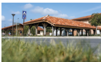
La rénovation du lavoir près de la balade des senteurs.