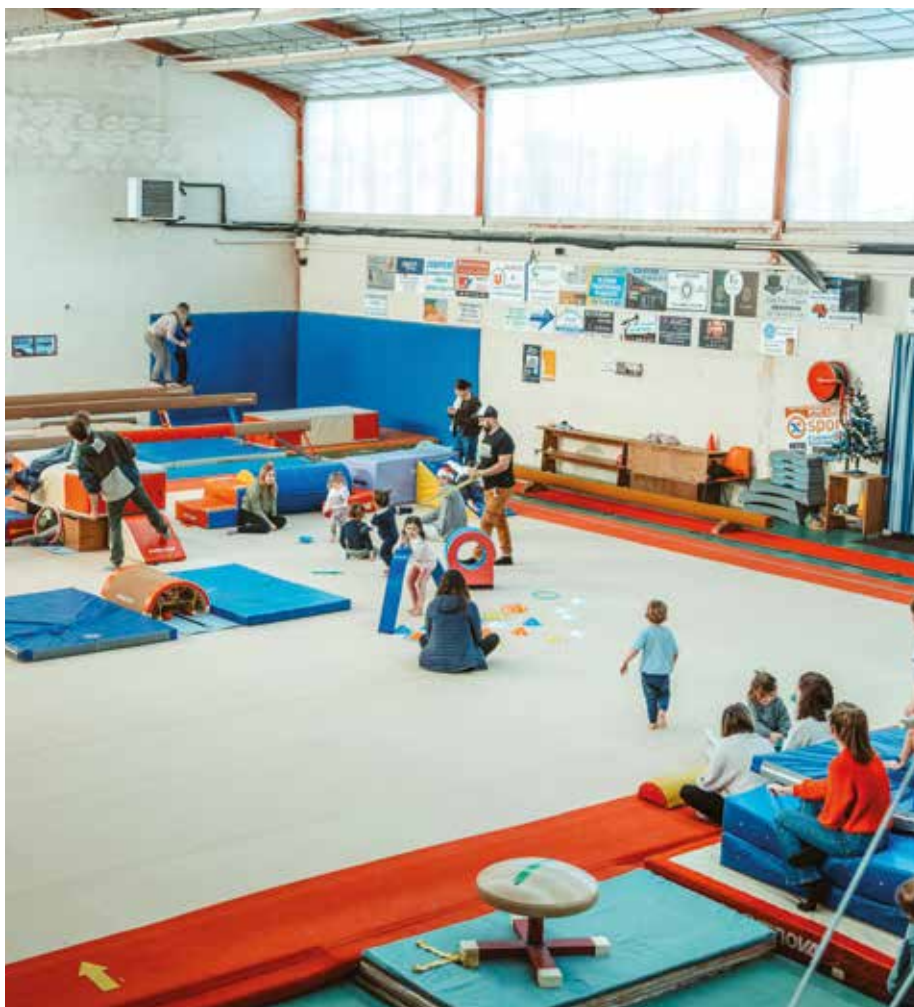
la gym des "Ecureuils" pour les tout-petits le samedi matin.

Derrière ces incontournables, on retrouve comme une évidence à Soustons, les associations solidaires, caritatives et citoyennes (15% des associations), qui se mobilisent toute l'année auprès des plus démunis, auprès de celles et ceux qui ont le plus besoin d'aides. Elles sont les moteurs de nos élans solidaires, et des collectes nationales menées sur notre territoire.