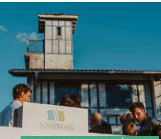
SEPT 2024 - POSE DE LA PREMIÈRE PIERRE