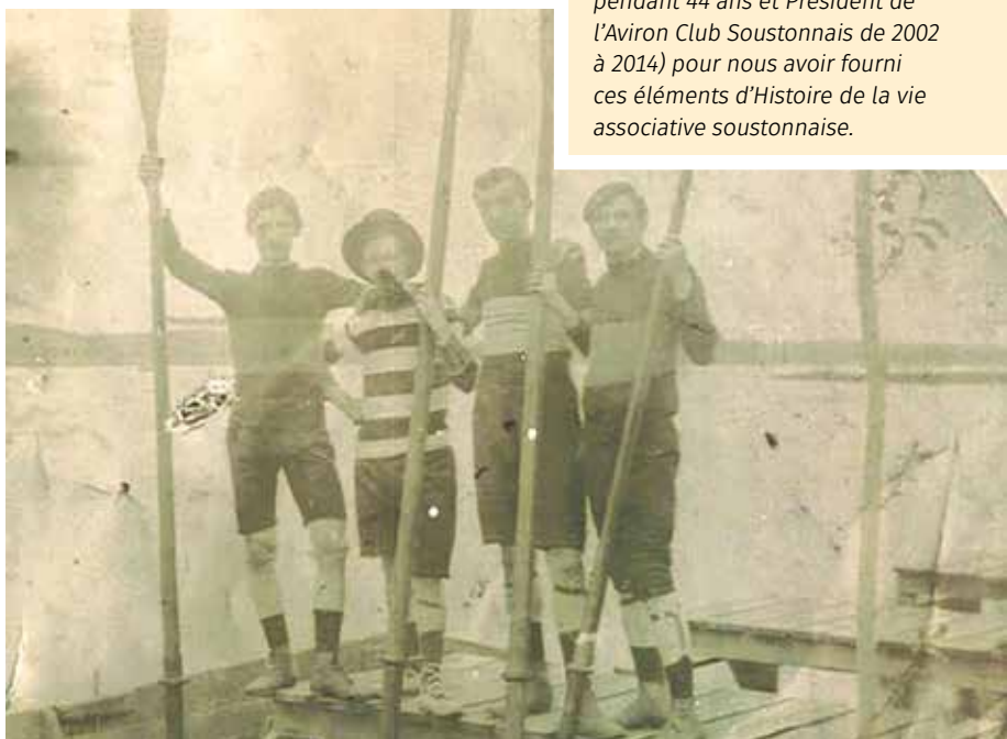
Les premières épreuves d'aviron en 1903 sur le lac de Soustons.