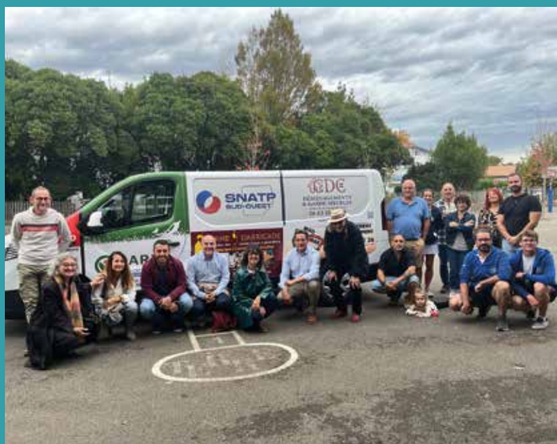
Les entreprises locales au soutien de la vie associative