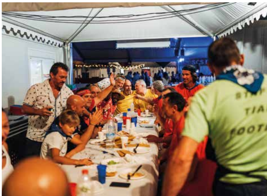
Les TIAPS, essentiels à nos moments de partage.

Un formulaire de demande de réservation de salles ou de prêt de matériel est mis en ligne , sur la page d'accueil du site de la mairie, à partir de l'onglet « Réservations de salles ».